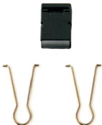
Mocowanie ze spinkami