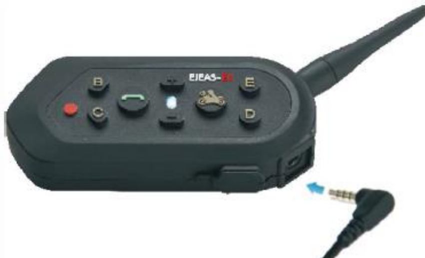
Podłączenie zestawu mikrofon/słuchawki