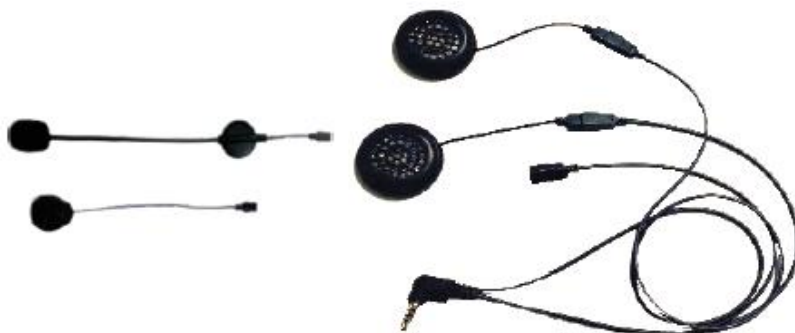
Słuchawki i mikrofony