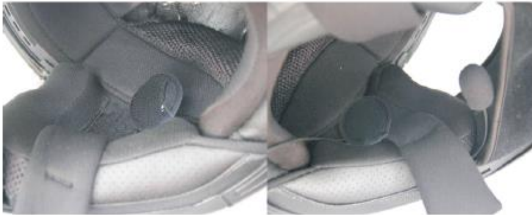
Miejsce do zainstalowania słuchawek i mikrofonu