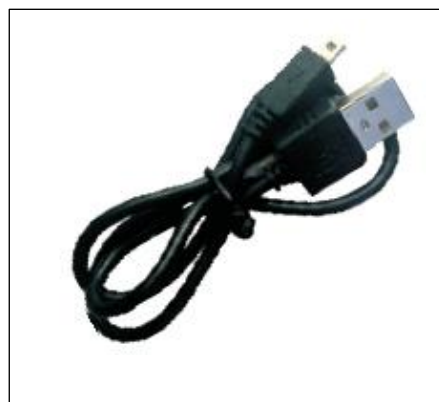
Kabel ładowania USB