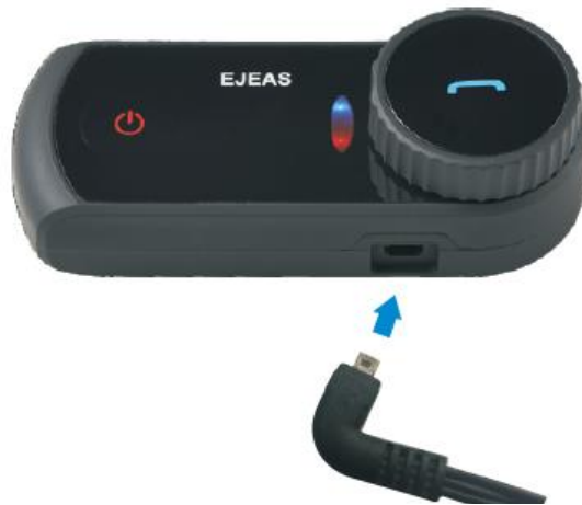
Podłączenie zestawu mikrofon/słuchawki