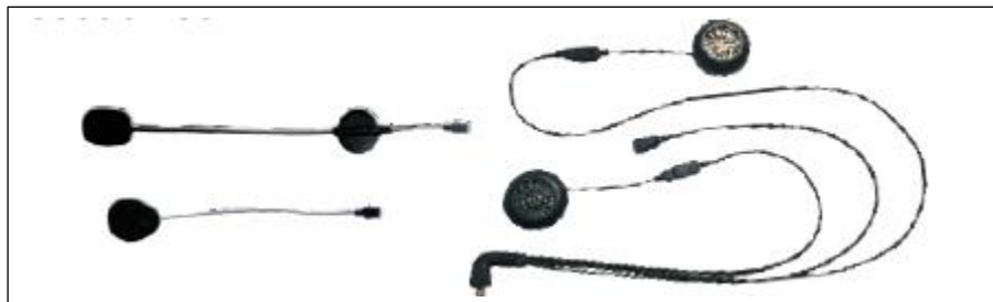
Mikrofony i słuchawki